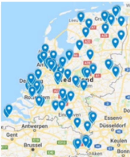
spreiding van de gecertificeerde scholen

Aan het begin van het schooljaar 2019-2020 werkte het Jeugdeducatiefonds samen met 91 basisscholen, scholen met meer dan 50% van de kinderen uit de doelgroep: een thuissituatie met een inkomen tot 150% van het minimum. Het was de ambitie om in het schooljaar 2019-2020 uit te breiden naar 150 scholen. Die doelstelling werd op 17 maart 2020 gerealiseerd.